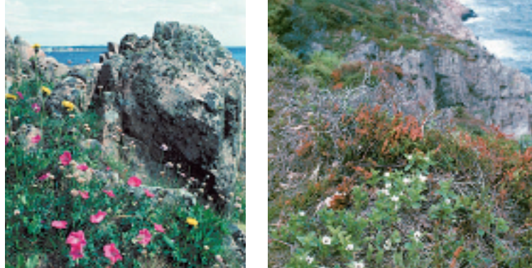
Blodnäva vid Ransvik